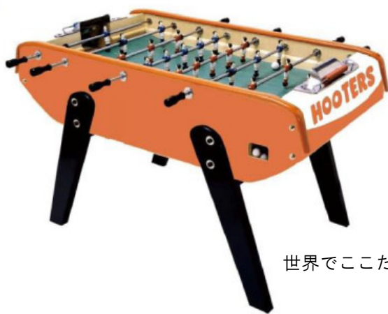
世界でここだけの HOOTERS カラーサッカーゲーム！