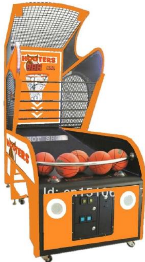
カーニバルゲームの王道、バスケットボールでスポーツ体験！