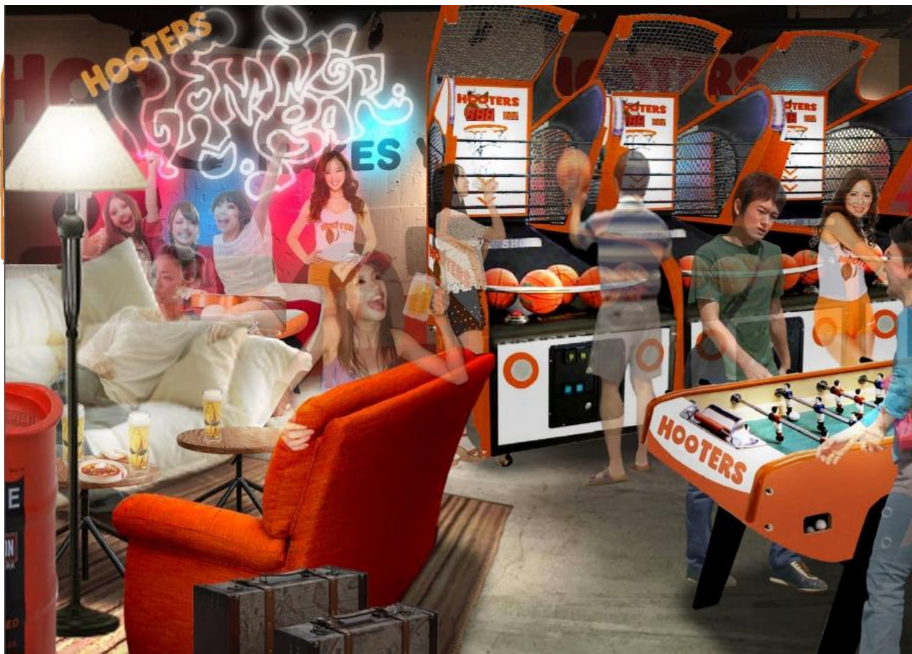
“SIDE-B”内は HOOTERS カラーで演出された各種スポーツコンテンツとスタイリッシュな家具やオブジェで構成