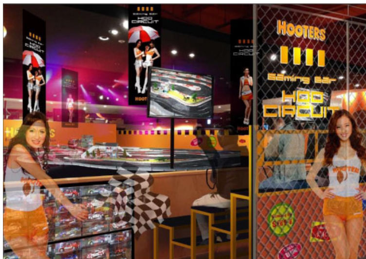
都内最大級のスロットカーコース“渋谷サーキット”も登場！