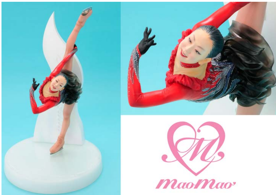
『DIGITAL GRADE MASTER 浅田真央』（9,800円/送料・手数料別途必要）

2012年2月3日（金）11時より受注開始で、商品の発送は、2012年7月頃を予定しています。