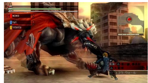
アラガミの能力を“捕喰”

多種多様な「アラガミ」から「素材」を入手して合成・強化することで、より強力な「神機」を創り出すことも本作の醍醐味の一つです。