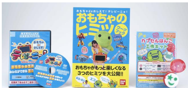
『おもちゃ de おしえて！テレビーニョ！DVD 授業キット』 画像左から:教材 DVD、ワークブック、工作キット