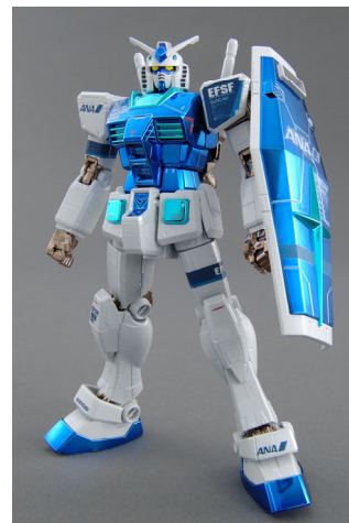
HG 1/144 ガンダム G30th ANAオリジナルカラーVer.