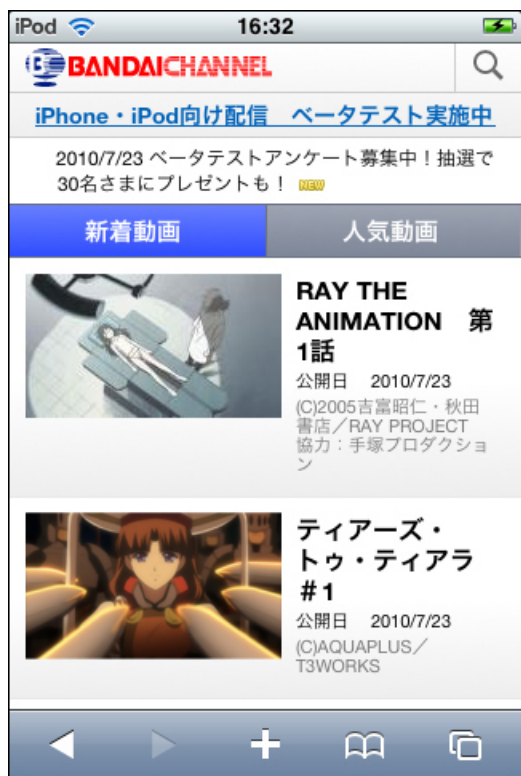
【iPhone, iPod touch 向けサイト】

バンダイチャンネルは本サイトをご利用していただいた方々の体験に基づくご意見・ご要望の収集・解析と技術的なネットワーク検証を目的として、今回ベータテストを実施します。ご利用いただいた方々のご意見・ご要望や実施結果により、今後お客様に満足いただける配信手法や視聴スタイルの創造・実現に努め、映像配信の新たな価値を提供してまいります。