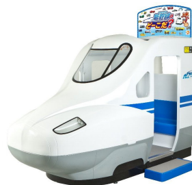
ゲーム機イメージ

また、ゲーム終了後にカードの払い出しがあり、オモて面には新幹線の写真、ウラ面には新幹線に関する情報を掲載。カードは全41種類あり、親子で一緒に見て、読んで楽しめます。