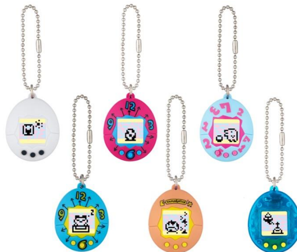
『かえってきた! ちびたまごっち』

2017年4月8日(土)発売、全6柄、1,620円・税8%込/1,500円・税抜 画像上段左から、白、ピンク、水色 下段左から、ブルー、オレンジ、スケルトン