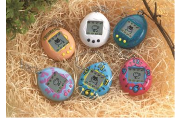
1996年 初代「たまごっち」

「たまごっち」シリーズは、2016年11月23日に発売20周年を迎えました。1996年11月23日に発売した携帯型育成ゲーム「たまごっち」は、1996年の発売から約2年半で全世界累計約4,000万個を販売し大ヒット商品となり、社会現象を巻き起こしました。2004年には、「かえってきた!たまごっちプラス」として復活。赤外線通信機能による通信遊びが小学生女子を中心に支持され、2004年以降、全世界で累計約4,100万個以上を販売し、1996年からこれまでに累計8,100万個以上を販売しています(2016年3月末現在)。