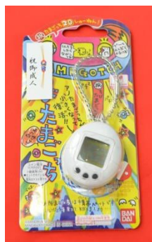
▲新成人に贈呈した『かえってきた！ ちびたまごっち』