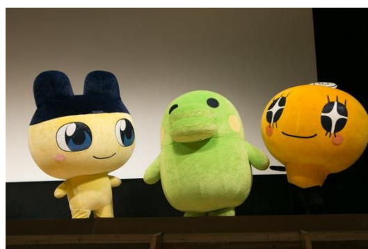
▲ステージに立つたまごっちキャラクター