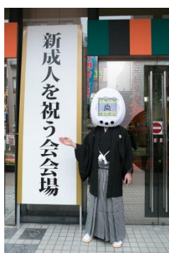
▲式典に参加する「初代たまごっち」