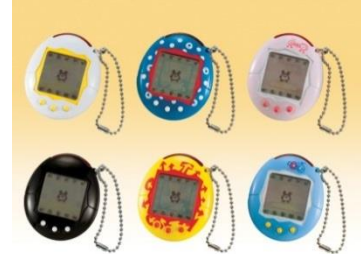
2004年「かえってきた!たまごっちプラス」 (赤外線通信が可能に)