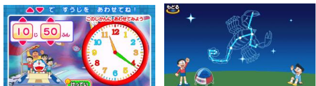
【とけいのよみかた】 【ほしをつなごう】

身のまわりの物をひみつ道具を使って調べたり 時計の読み方などの生活習慣や星座などを学べます。