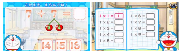
【たしざんをしよう】 【くくをおぼえよう】