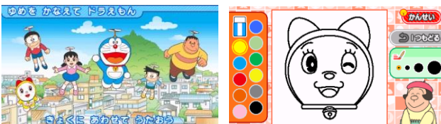
【カラオケでうたおう】 【おえかきしよう】