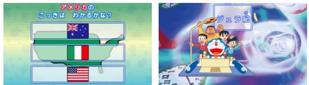
【どこでもドアでいこう】 【タイムマシンでじゃかんりょこう】