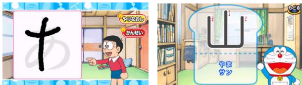
【かいてみよう(ひらがな/カタカナ)】 【かんじをしらべよう】