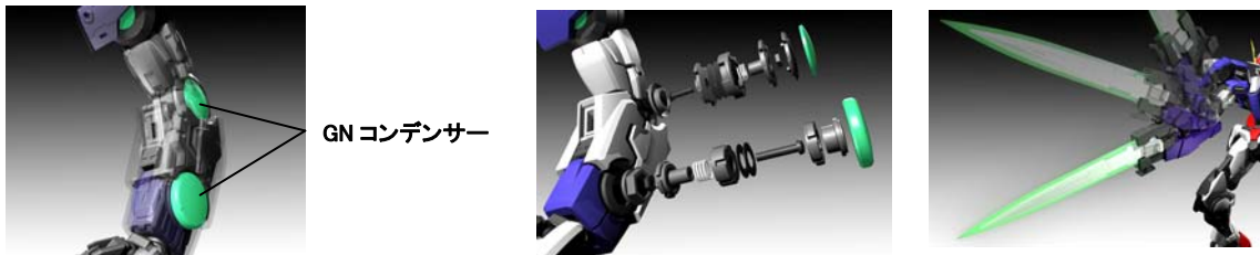
上記画像の緑色の丸いボタン（劇中で「GNコンデンサー」と呼ばれる部位）を押すと、関節の角度が固定される

肩、肘、手首、膝の各関節（8箇所）には、新たに設計したクラッチ機構を採用。これにより大型武器の保持が容易になりました。