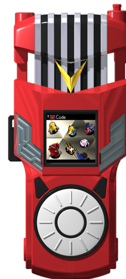
デジモンクロスローダー (7,140円/税込)

今後も、バンダイは全社を挙げて「デジタルモンスター」シリーズを盛り上げていきます。今後の展開にご注目ください。