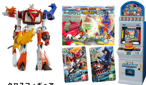
クロスフィギュアシリーズ合体例 データカードダス デジモンクロスウォーズ スーパー 超デジカ大戦

バンダイは、この他にも関連商品を続々と展開する予定で、8月には第1弾として、「クロスフィギュアシリーズ」(1,890円～)を発売します。これは、TVアニメ「デジモンクロスウォーズ」(全国テレビ朝日系列・毎週火曜日夜7時27分～)と同様に、「デジモン」同士を変形・合体させ、新しい「デジモン」として遊ぶことができる商品です。この他にも、データカードダス『デジモンクロスウォーズ スーパー 超デジカ大戦』(夏稼働予定/1プレイ1枚100円、2プレイ2枚200円/税込)や、カプセル商品、玩具菓子、日用品など、幅広いカテゴリーで商品を展開し「デジタルモンスター」シリーズを盛り上げていきます。