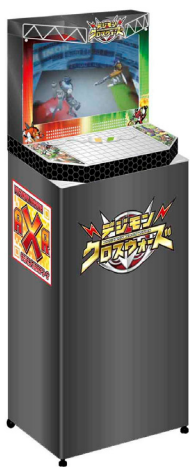
「デジモンクロスアリーナ」 ※画像はイメージです。

今回の発売に際し、全国の販売店約200店舗に無料で遊べるデジモン召喚バトル仕器「デジモンクロスアリーナ」を導入します。18インチカラーモニターを搭載し、AR(Artificial Reality/拡張現実)の技術を応用して、今までにない店頭での遊びを提供します。『デジモンクロスローダー』と赤外線連動しており、自分の育成した「デジモン」を通信させ、画面内でバトルして遊ぶことができます。また、通信することで新たな「デジモン」を「デジモンクロスローダー」に入手することができます。