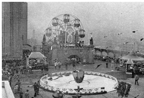
初代 通称「お城観覧車」 (1968～1989年)

この度、「東急プラザ 蒲田」に復活する「屋上観覧車」は、1968年に設置され、「東急プラザ 蒲田」が一時閉店した2014年3月までの46年間、地域の人々に愛され続けてきました。初代の通称「お城観覧車」から、1989年に二代目の「グレ太の観覧車 フラワーホイール」にバトンタッチし、今日まで親子三代のお客様にご利用いただくなど、多くのお客様に楽しい思い出をお届けしてきました。そして、都内で唯一現存する屋上観覧車となり「蒲田のランドマーク」として全国にも知られていました。今回復活する観覧車はカラーリングも新たに、さらに幅広い皆様に親しまれることを目指します。