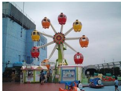
2代目「グレ太の観覧車 フラワーホイール」 (1989～2014年)