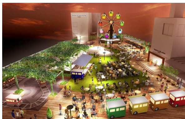
リニューアルオープン後 屋上イメージ 2014年10月9日～