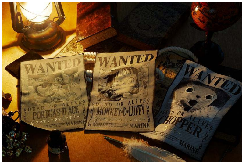
『織アートTHE・手配書』(左から：エース、ルフィ、チョッパー 各別売り) (各2,600円/税込)

本商品は、番組内に登場する海賊たちの顔やその懸賞金の金額が記載された“指名手配書”を再現した織物で、雨風にさらされた風合いのレトロな質感あふれる仕様が特長です。今回は、主人公“ルフィ”をはじめ、人気キャラクターの“エース”、“チョッパー”の3種類を発売し、今後も他キャラクターでの展開を予定しています。本商品は、手配書が番組内で彼らを指名手配している“海軍本部”から配布される様子をイメージし、海軍エンブレムが入ったオリジナルの「海軍秘密伝令管」風ケースに収められた状態で自宅に届くため、「ONE PIECE」ファンにはたまらない一品となっています。