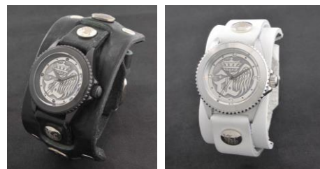
『Musikleidung angela × Red Monkey 腕時計』 左:KATSU モデル、右:atsuko モデル 全2種 各 48,600円・税8%込 ※展示受注