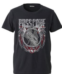
『Musikleidung PassCode Tシャツ』