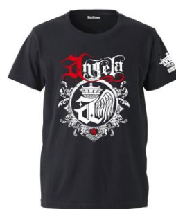
『Musikleidung angela Tシャツ』