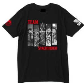
『Musikleidung チームしゃちほこ ×HTML03 Tシャツ』 全5色

Tシャツはすべて 3,780円・税8%込、サイズ:メンズ S・M・L・XL(angela コラボのみ XXL 含む 5サイズ展開)