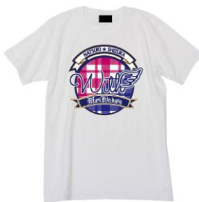
『Musikleidung アイドル事変×HTML03 Tシャツ』 左:with デザイン、右:A.I.S デザイン 全2種