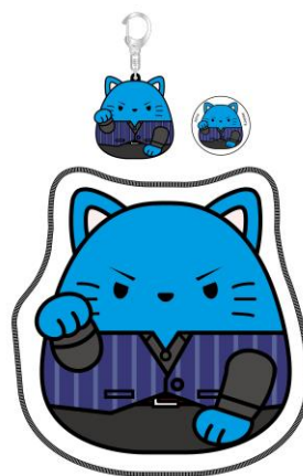
『まねきもちねこ スタンドマイヒーローズ 青山樹 セット』

バンダイ公式のキャラクターファッションポータル「バンコレ！」： http://bandai-fashion.jp/ バンダイ公式サイト： http://www.bandai.co.jp/