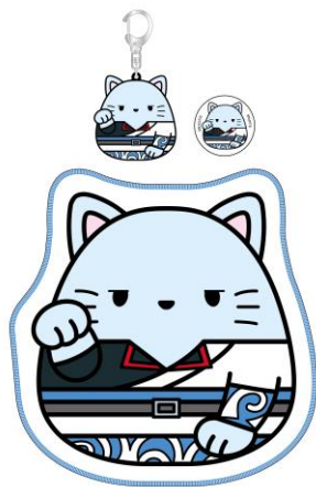
『まねきもちねこ 銀魂 坂田銀時 セット』

《商品ラインアップ(一部)》 各1,620円・税8%込 ※ダイカットミニタオル、ラバーチャーム、缶バッジの3点セット ※バンダイアパレル LIMITED STORE では1月30日(月)より販売します。