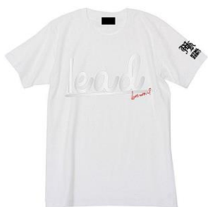
『Musikleidung 鈴木このみ ×HTML03 Tシャツ』