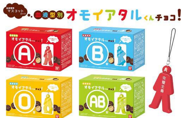
「血液型別 オモイアタルくんチョコ！」(全4×10種・各189円/税込)

バンダイは『血液型別 オモイアタルくんチョコ！』を、2011年3月末までに100万個販売する計画です。