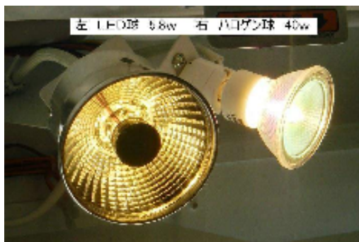
左 LED球 5.8w 右 ハロゲン球 40w

この施策により、今年度削減できる CO 2 排出量は、年間約 591 t-co 2 となります。経費削減(光熱費・メンテナンス維持費)についても、初年度で初期投資 3,400 万円を回収し、次年度より同額の経費削減が図れる計画です。