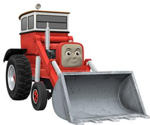
ホイールローダーのジャック