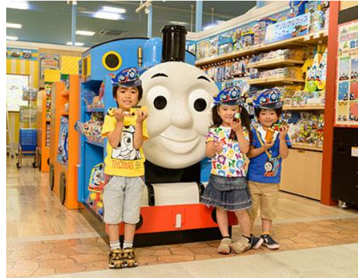
※画像はイメージです