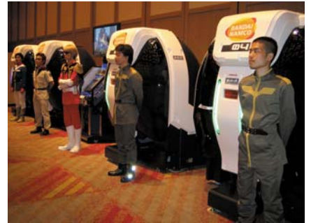
9月13日に開催された「バンダイナムコグループ経営戦略説明会」の会場で、進行中のシナジー企画として展示された「機動戦士ガンダム 戦場の絆」 ©創通エージェンシー・サンライズ

また間接機能を関連事業グループとして集約し、グループ全体の業務の効率化とサービスの向上を目的としたシェアードサービス機能も検討していきます。グループ全体の体制についてはこれが最終形態ではなく、今後成長の可能性が高い事業などを新たなビジネスユニットとして独立させるなど、常に最適な体制を目指し、ポートフォリオ経営を進化させていきます。