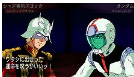
ゲーム画面 (臨場感溢れるダブルカットイン)