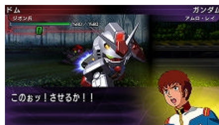
ゲーム画面 (ワイド画面で迫力のバトルを展開)

前作では途中までしか収録されていなかった「 ターンエー ガンダム」のシナリオを完全収録したほか、アニメ最新作「機動戦士ガンダム SEED」 、 「機動戦士ガンダム SEED DESTINY」のシナリオも収録。プレイヤーは好きな作品を自由に選んで、どのシナリオからでもプレイすることができます。