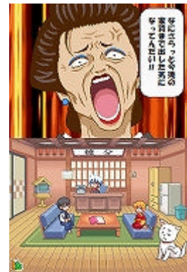
ゲーム画面 (ゲームの舞台となる万事屋)

借金返済の依頼や日々起こるさまざまな出来事がミニゲームになっています。ニンテンドーDSならではのタッチペンを生かしたゲームや、登場するキャラクターの個性を生かしたゲームなど20種類以上を収録しました。