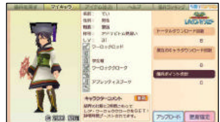
ネットワークモード

PSPのネットワーク機能を使用して、自分の育てたオリジナルキャラクターデータを“傭兵”として専用サイトにアップロードしたり、他の人が育てた“傭兵”を自分のPSPにダウンロードして冒険の仲間に加えることができます。