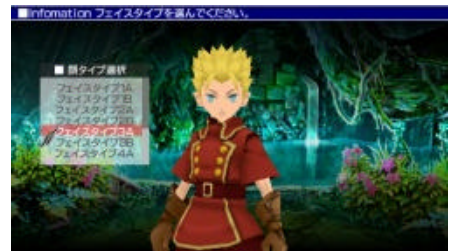
オリジナルキャラクター作成

冒険の始めにプレイヤーは自分の分身であるキャラクターを作成します。性別や容姿、声、戦士や魔術師などのクラス(職業)等を選択し、「世界樹の守り手」である主人公として自分だけのオリジナルキャラクターを作り上げます。宿屋で仲間をスカウトしパーティを結成したら、いよいよ冒険に旅立ちます。