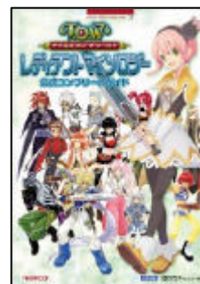
攻略本カバーイラスト

バラエティ豊かなゲームをより深く楽しめるよう、ゲーム中のデータをあますところなく掲載。各種装備・アイテム類の入手方法や性能から、300にもものぼるクエストの発生条件と全内容を網羅しました。料理や鍛冶などの生産レシピや称号、モンスターデータ、術技、フェイスチャットなども全て公開し、本作を繰り返し楽しめる内容になっています。