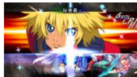
秘奥義カットインアニメ

冒険を進めていくと、キャラクターイラストを画面上で見られるア イテム「イラスト本」が入手できます。このアイテムで、いのまたむつ み氏が描く繊細で力強い原画や、かわいらしい“ちびキャライラスト” など多彩なイラストを収集することができます。