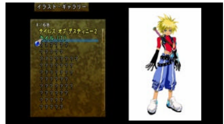
イラストギャラリー

本作の戦闘システムは「TT-LMBS(トラスト&タクティカル リニア モーションバトルシステム)」。トラスト(仲間との信頼感)とタクティ カル(戦略的)の2つの要素が重要な影響を及ぼす戦闘システムです。 従来の『テイルズ オブ』シリーズのリアルタイム性や仲間ごとの役割 分担、コンボシステム(術技の連携)を大幅に発展させ、キャラクター の精神力によって命中率や回避力が左右される「SP(スピリッツポイント) ゲージ」と合わせて、アクション性が高く白熱した戦闘がお楽しみ いただけます。