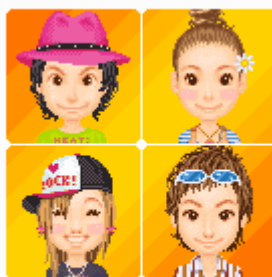
au one アバター

EZ アプリを使って、顔や髪型、服装など様々なアイテムを組合せて自分だけのオリジナルキャラクターを作ることが出来ます。Web サイト上では、作成したアバターを使ってファッションコンテストへ参加したり、デコレーションメールのテンプレートを作成することができます。また、「au one ブログ」や「au one My Page」などの連携サイト上で、自分の姿としてアバターを表示することが可能です。さらに、ポータルサイト「au one」に登録すれば PC からのご利用いただけます。