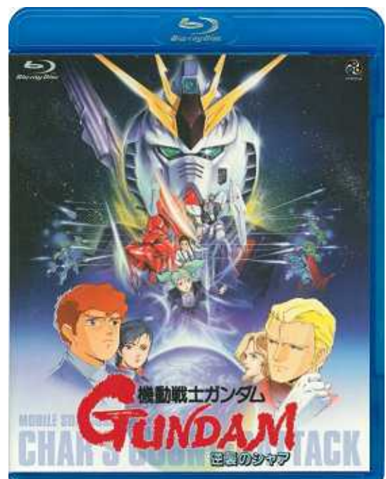
「機動戦士ガンダム 逆襲のシャア」