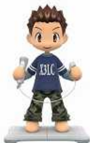
バランスWiiボード使用時姿勢：スキー

『ファミリースキー』同様、「バランスWiiボード」を接続して遊ぶことができます。接続時には下半身の重心移動で前後にバランスを取りターンを切るので、実際にスキーやスノーボードをしているような感覚で楽しむことができます。