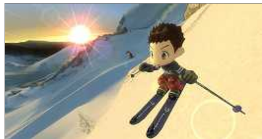
ゲーム画面(マウント・アングリオの急斜面)

頂上部では 360 度見渡す限りに雲海が広がる、圧雪や整備がされていないビッグマウンテンです。プレイヤーはヘリコプターに乗って登り、断崖絶壁の急斜面や岩肌剥き出しの起伏に富んだ斜面を滑り降ります。上級者でもめったに経験できないような、限界を超えた大自然の雪山での滑走を満喫いただけます。