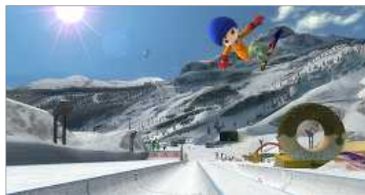
ゲーム画面(ハーフパイプでトリック)

また、ハーフパイプやレールキッカー、エア台などの人工トリック施設も多数設置されており、スピード感あふれる華麗な滑りを味わうことができます。