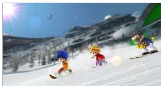
ゲーム画面(スキーとスノーボードで滑走)

また、滑走中にジャンプをして「グラブ」や「フリップ」などさまざまなトリックを決めることもできるなど、より本物のスキー・スノーボードに近いアクションで滑ることもできます。