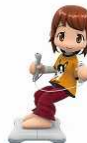
バランスWiiボード使用時姿勢：スノーボード

バンダイナムコゲームスは、世界中の人々に感動と豊かで楽しい時間を提供し続けるため、あくなきチャレンジを続けます。