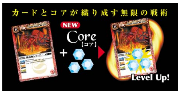
(写真)コアの使用イメージ (C) サンライズ・メ〜テレ

カードのデザインは、新進気鋭のデザイナーたちによる繊細なタッチ、かつ印象的なスピリットたちが描かれており、コレクションアイテムとしてもお楽しみいただいています。