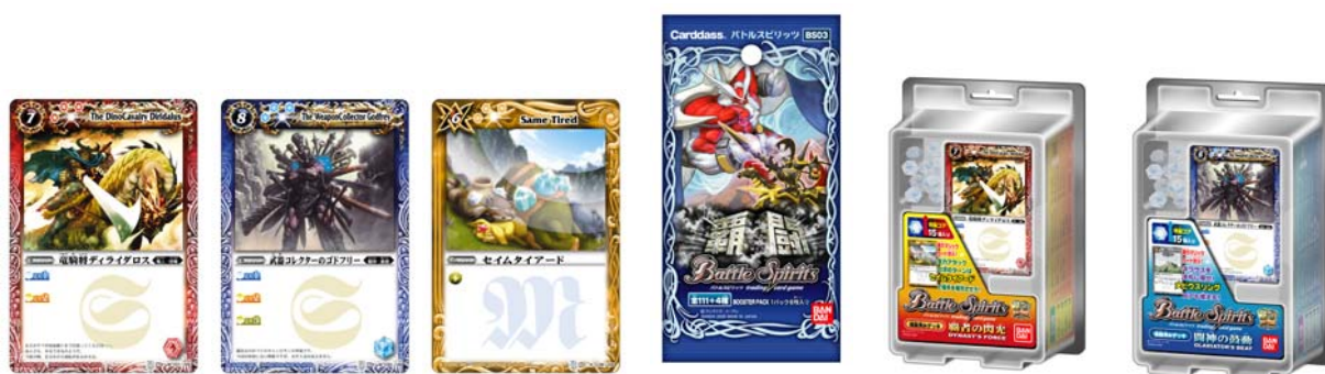
写真左:Battle Spirits【覇闘】[BS03]カード一例、