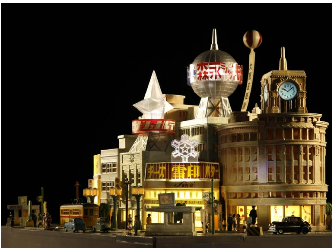
↑銀座4丁目方面から見た夜の銀座(写真上)

また、「昭和銀座ジオラマ」と今後展開予定の「タイムトリップシリーズ」は 2009 年 2 月 3 日(火)～6 日(金)まで東京ビッグサイトで開催される「第 67 回インターナショナルギフトショー」【東京ビッグサイト 東 1 ホール 住所：東京都江東区有明 3-21-1】のバンダイブースに出展します。是非、バンダイブースへお越しください。