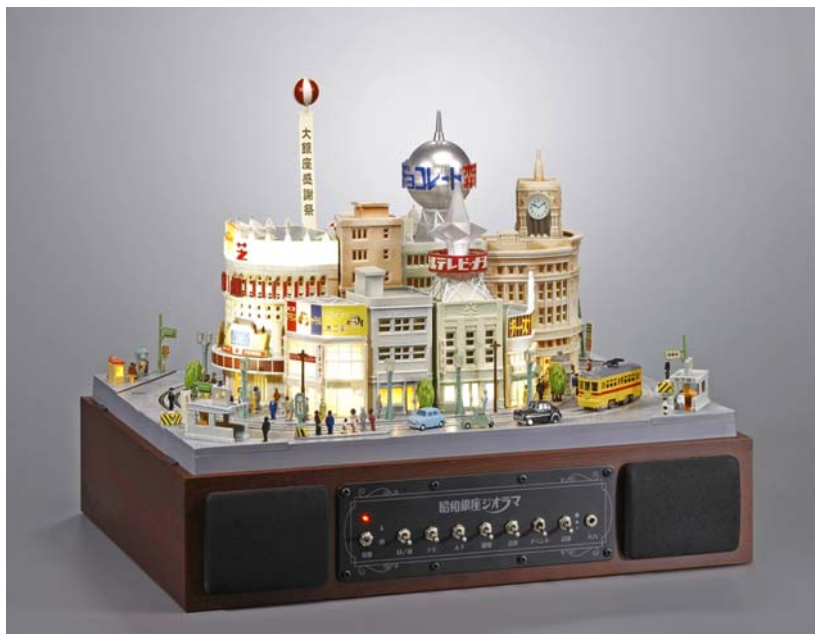
「昭和銀座ジオラマ」(198,000円・税込) ©BANDAI 2009

バンダイは、この商品を2009年12月末までに2,000台の販売を計画しています。