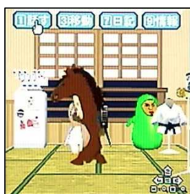
【図2】番組に関係する「動き」を覚える(卓球の素振り)

ワンセグで番組を視聴中に、データ放送部分に表示されるボタンをクリックすることで、アプリ内のキャラクターが「言葉」や「動き」を覚えます。視聴番組のジャンルや時間によって「言葉」や「動き」「アイテム」の種類も異なり、言葉を覚えていくにつれ、覚えた言葉を組み合わせることでセリフを発します。例えば、世界卓球の期間中にワンセグデータ放送を視聴し、翌日以降にアプリを起動すると、キャラクターが卓球の素振りをしたり、卓球にまつわる言葉を覚えてセリフを発したりします【図2・3】。また、ワンセグを受信できなくても、アプリを立ち上げるだけで1日10個の言葉をサーバから受信することができ、サーバ内に保管されている他のプレイヤーのキャラクターが住む「部屋」を訪問し、しりとりをして勝つことで、相手の覚えている言葉をもらうこともできます【図4】。 さらに、キャラクターは毎日日記をつけており、各キャラクターの日々のドラマを楽しむこともできます。