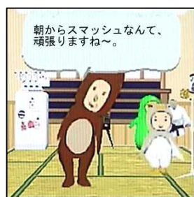
【図3】番組に関係する「言葉」を覚える(卓球のスマッシュ)