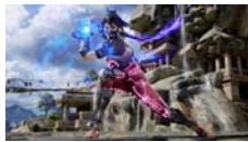
ソウルキャリバーVI