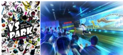
バラエティスポーツ施設 “VS PARK”