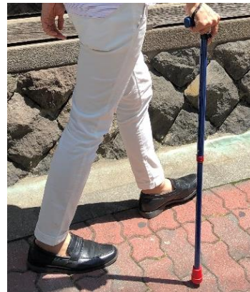
▲商品使用イメージ

福祉用具市場は日本国内で約1兆4,337億円規模(2015年度)とされています。軽度者の利用が多い「歩行補助杖」の2015年度市場は48億円で、2011年からの5年間で120%に拡大しています※1。