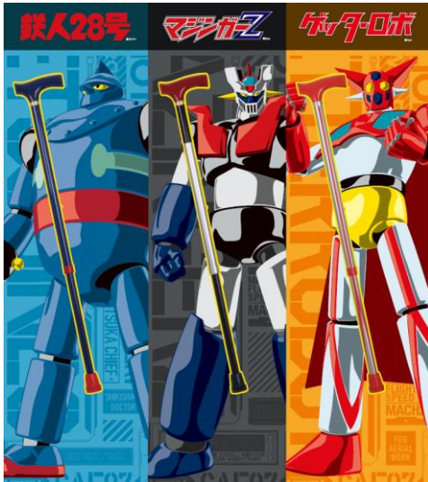
◀メインビジュアル

バンダイは、福祉用具メーカーの大手である幸和製作所の得意とする「歩行補助杖」をきっかけにシニア市場へ参入し、ターゲット層と事業の拡大を図ります。