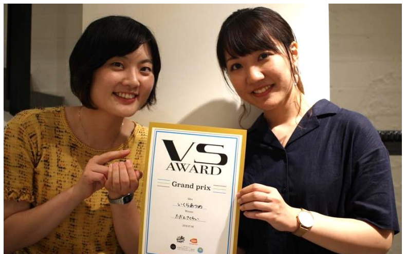
グランプリを受賞し、アイデアが採用となった大学生