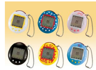
2004年 『かえってきた！たまごっちプラス』 (赤外線通信が可能に)