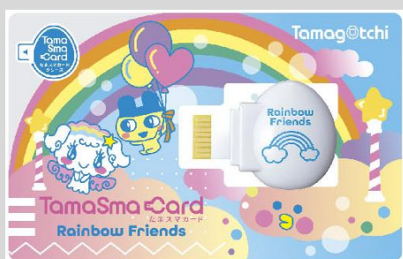
「たまスマカード レインボーフレンズ」

本商品の連動アイテム「たまスマカード」(11月23日(火・祝)発売、1,100円・税10%込)を本体に挿入すると、育てられるたまごっちやカスタマイズ用のさまざまなアイテムを本体内にダウンロードすることができます。多種多様なテーマでシリーズとして継続的に展開予定です。