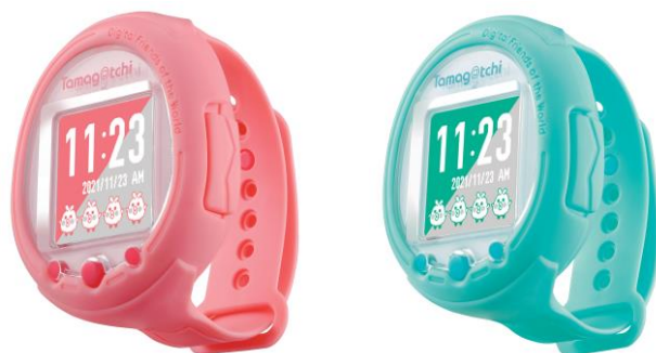
▲ Tamagotchi Smart(たまごっちスマート)コーラルピンク、ミントブルー

③ウェアラブル型でより身近な存在に:スマートウォッチのように身に付けて持ち歩ける形状を採用しました。身に付けることで、歩数がカウントされてたまごっちのリアクションが変化するほか、動きを検知して遊べるダンスゲームなども楽しめます。