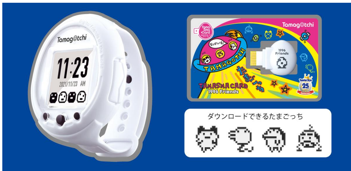
▲限定カラーの「Tamagotchi Smart(たまごっちスマート)」と「たまスマカード 1996 フレンズ」

本発売に先駆け、バンダイナムコグループの公式通販サイト「プレミアムバンダイ」にて 6 月 17 日(木)~7 月 2 日(金)の期間で「Tamagotchi Smart 25thアニバーサリーセット」(8 月お届け予定、7,480 円・税 10%込)の先行抽選販売を行います。1996 年に発売した初代たまごっちを彷彿とさせる、限定カラーの「Tamagotchi Smart(たまごっちスマート)」本体と、当時の白黒ドットを再現したキャラクターやアイテムが楽しめるたまスマカード「たまスマカード 1996 フレンズ」がセットになっています。最新機種種の「Tamagotchi Smart(たまごっちスマート)」と初代の「たまごっち」の世界観を、両方を楽しむことができる、まさに 25 周年を記念したアニバーサリー商品を世界最速でお届け予定です。