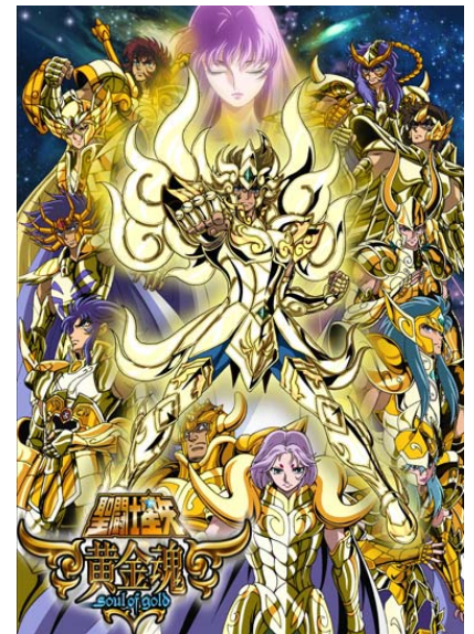
『聖闘士星矢 黄金魂-soul of gold-』 キービジュアル

今後もバンダイナムコグループでは『聖闘士星矢』シリーズの商品化を継続し、キャラクターを盛り上げるとともに、世界へと発信していきます。