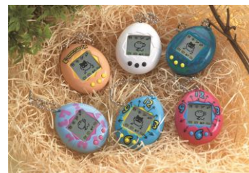
1996年 初代「たまごっち」

1996年11月23日に発売した携帯型育成ゲーム「たまごっち」は、今年で20周年を迎えます。1996年の発売から約2年半で、全世界にて累計約4,000万個を販売して大ヒット商品となり、社会現象を巻き起こしました。2004年には、「かえてきた!たまごっちプラス」として復活。赤外線通信機能による通信遊びが小学生女子を中心に支持され、「たまごっちプラスシリーズ」以降、全世界で累計約4,100万個以上を販売し、1996年からこれまでに累計8,100万個以上を販売しています(2016年3月末現在)。現在では玩具だけでなく、キャラクターとしての人気も定着しています。