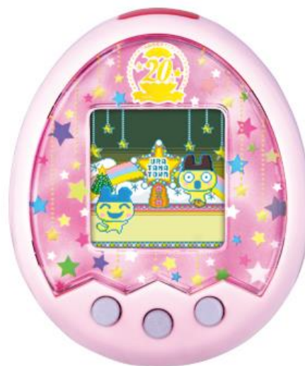
『Tamagotchi m!x 20th Anniversary m!x ver.』 11月23日(水・祝)発売、全2色、オープン価格 ロイヤルホワイト(左)、ロイヤルピンク(右)