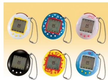
2004年「かえてきた!たまごっちプラス」 (赤外線通信が可能に)