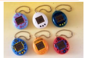
本商品での“ばんぞー博士”の「けんきゅうじょ」画面(左)と初代「たまごっち」(右)