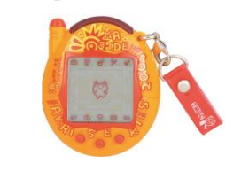
本商品での「まっかっかタウン」画面(左)と「祝ケータイかいっすー！たまごっちプラス 赤いシリーズ」(右)