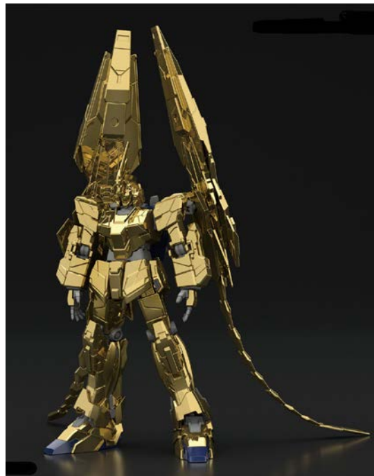
HGUC 1/144 ユニコーンガンダム3号機フェネクス (ユニコーンモード)(ナラティブVer.) [ゴールドコーティング] 5,400円・税8%込、8月発売予定 ©創通・サンライズ