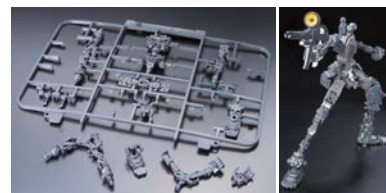
アドバンスドMS ジョイント

2010年7月 ガンプラ 30周年を記念して、異材質多重インサート成形により、切り取るだけで劇中の動きをトレース可能な可動を 1/144 スケールに集約した内部フレーム「アドバンスドMS ジョイント」を搭載した「RG RX-78-2 ガンダム」発売。ガンプラ累計出荷数 4 億個を突破