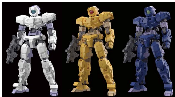
30 MINUTES MISSIONS 1/144 eEXM-17 アルト[ホワイト/イエロー/ブルー] 1,382円・税8%込、6月発売予定

なかでも、簡単組み立てという新しいコンセプトのプラモデル「30 MINUTES MISSIONS」 ミニッツ ミッションズ は、ランナーのパーツ配置構成を直感的にわかりやすい配置に見直すことで、パーツを探す手間を省き、さらに頭部、胸部、腕部と配置されたパーツを順番に組み立てていくことで、組み立て時間を劇的に短縮している新シリーズです。また、組み立てに接着剤は使用せず、豊富なカラーバリエーション展開により、塗装せずに機体のカラーコーディネートを楽しむことができます。また、共通の関節構造にすることで、機体同士の組み換えやパーツの換装、武装のカスタマイズが楽しめます。