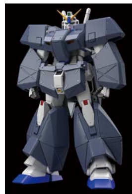
MG 1/100 ガンダム NT-1 Ver.2.0 6,264円・税8%込、6月発売予定 (左:本体、右:チョコバム・アーマー装着時) ©創通・サンライズ