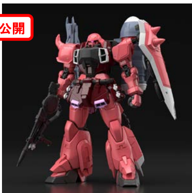
MG 1/100 ガナーザクウォーリア (ルナマリア・ホーク専用機) 4,664円・税8%込、9月発売予定