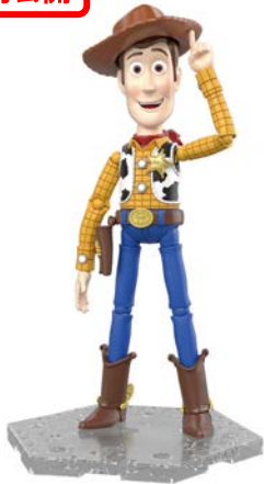
【トイ・ストーリー4】 トイ・ストーリー4 ウッディ 3,240 円・税 8%込、7 月発売予定 ©Disney/Pixar