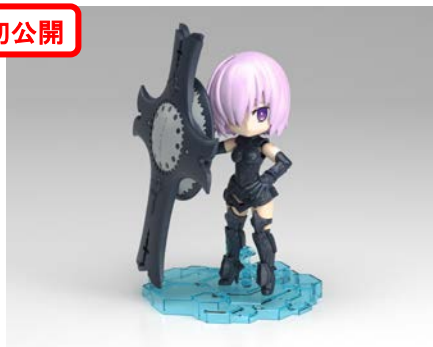
【Fate/Grand Order】 ぷちりっつ シールダー/マシュ・キリエライト 1,512 円・税 8%込、8 月発売予定 ©TYPE-MOON / FGO PROJECT