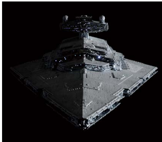
【スター・ウォーズ】 1/5000 スター・デストロイヤー ライティングモデル 初回生産限定版 12,960 円・税 8%込、8 月発売予定 ©&™ Lucasfilm Ltd.