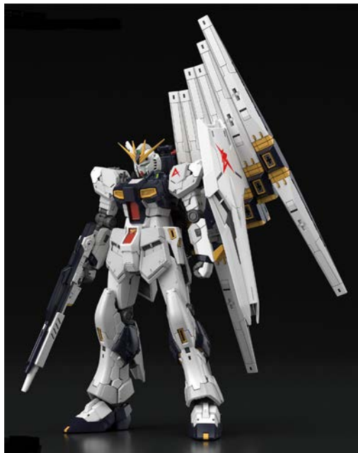
RG 1/144 RX-93 ヲガンダム 4,536円・税8%込、8月発売予定 ©創通・サンライズ

「ガンプラ」の主な発表・展示ラインアップは、『機動戦士ガンダム 逆襲のシャア』(1988年公開)より、「RG 1/144 RX-93 ヲガンダム」(4,536円・税8%込、8月発売予定)や昨年劇場公開した『機動戦士ガンダム NT』(5月24日(金)Blu-ray&DVD発売、配信スタート)より「HGUC 1/144 ユニコーンガンダム3号機フェネクス(ユニコーンモード)(ナラティブ Ver.)」[ゴールドコーティング](5,400円・税8%込、8月発売予定)などを展示します。