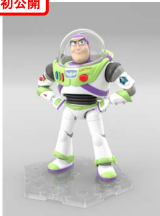
【トイ・ストーリー4】 トイ・ストーリー4 バズ・ライトイヤー 3,672 円・税 8%込、7 月発売予定 ©Disney/Pixar