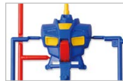
カラー多重インサート成形

1990年7月 MSジョイント、カラー多重インサート成形(同素材による1パーツ内での色再現)、4色イロプラと、当時の最新成形技術を1つの商品に集結した多色成形技術「システムインジェクション」を取り入れた「HGシリーズ」を導入し、「HG RX-78 ガンダム」など3種類を発売