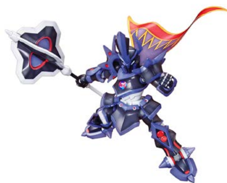
【ダンボール戦機】 LBX ジ・エンペラー 1,296 円・税 8%込、6 月発売予定 ©L5/PDS・TX