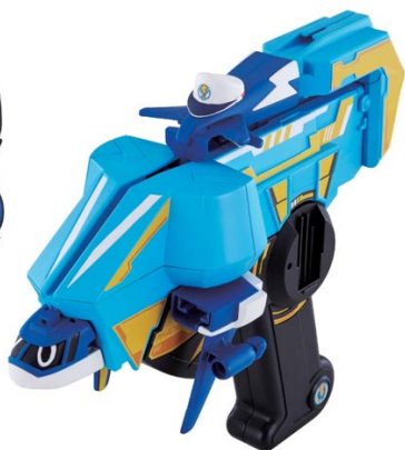
【ポチっと発明 ピカちんキット】 バトルピカちんキット 01 DX エアライドシューター & パワージャンボセット 3,024 円・税 8%込、5 月発売予定 ©PIKACHIN