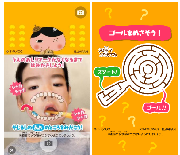
▲歯みがきガイド(左)と最後のスペシャルコンテンツ画面(右)

本コンテンツでは、画面下部に歯のイラストとみがくポイントのガイドが映し出されます。ガイドに口元を合わせ、示されたポイントのとおり歯をみがいていくと、みがき残しがなく歯をみがくことができるようになっていきます。指示ガイドは約10秒ごとに変化し、約2分30秒で歯みがきのコンテンツが終了します。仕上げみがきの際にもご活用いただけて、親子で楽しく歯みがきをすることができます。