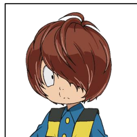
▲今後も「キュアグレース」や「鬼太郎」が登場予定