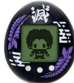
▲きさつたいっちカラー (Amazon 限定商品)