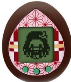
▲ねずこっちカラー