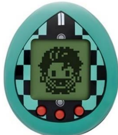
▲たんじろうっちカラー

TVアニメ「鬼滅の刃」は、原作漫画のシリーズ累計発行部数が 4,000 万部を突破するなど、社会的なブームを巻き起こしています。この度は、来年で誕生 25 周年を迎える携帯型育成玩具「たまごっち」をさらに多くの方にお楽しみいただくため、たまごっちに「鬼滅の刃」の世界観を落とし込み、さまざまな「隊士」の育成が楽しめる『きめつたまごっち』を開発しました。バンダイでは本商品をはじめ、玩具、カード、カプセルトイ、菓子・食品、アパレル、生活雑貨など、幅広い事業分野で「鬼滅の刃」の世界観を表現した商品を精力的に展開し、作品を愛するすべての皆さまへ楽しい時をお届けします。