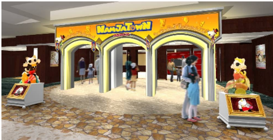
新エントランスイメージ

新アトラクションや、ナンジャ餃子スタジアム、福袋デザート横丁の登場、リニューアルコンセプトを体現した「ナンジャマイページ」などの詳細と、新ストーリーに関わる新たなキャラクターの登場が決定いたしましたのでお知らせいたします。