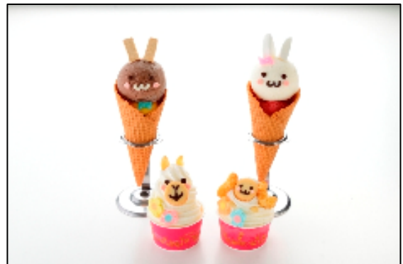
ジェラートの名店「ダ ルチアーノ」では デコジェラートが登場