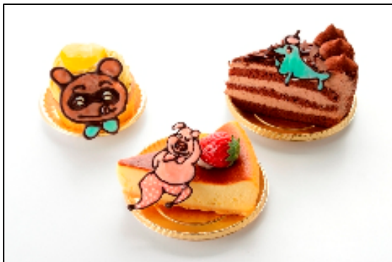
「Patisserie Cute」では かわいいデコケーキが登場