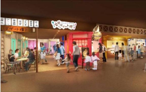
福袋デザート横丁イメージ

「福袋七丁目商店街」には、デコレーションされたデザート“デコデザート”を通年提供する「福袋デザート横丁」が新登場します。“デコデザート”づくりに定評のある職人が織り成す、動物などをモチーフにしたケーキやアイス等で、思わず誰かに伝えたいくなるおいしさと驚きを体験できます。プリン&チーズケーキのお店「Deco&Deco」は東京初出店となります。