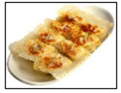
東京ひとくち餃子の名店 【赤坂ちびすけ】 「ちびすけ餃子」