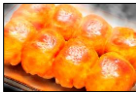
東日本餃子王 丸満 「丸満餃子」