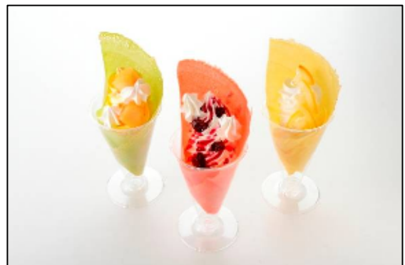
「サンタチューボー!」の パリパリ感が楽しいデコクレープ