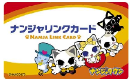
ナンジャリンクカードイメージ

ナンジャマイページの登録後は、このカード1枚で記録データの更新ができます。(価格：500円)