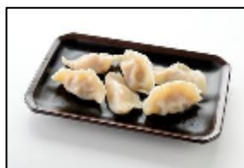
長崎新地中華街の名店 【老李】 「老李の長崎水餃子」