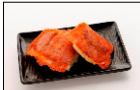
新感覚餃子【安亭】 「元祖チーズ羽根付き餃子」