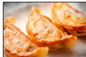
人気餃子王 包王 「牛とん包」