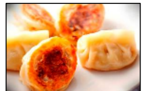
話題餃子王 華興 「華興餃子」