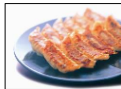
宇都宮市最多店舗数 【宇都宮餃子館】 「宇都宮 健太餃子」