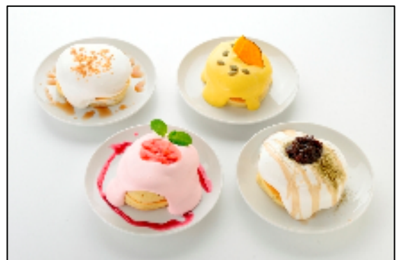
「レンガえんとつ」ではトッピングでデコレーションされた 新感覚のデコパンケーキが登場