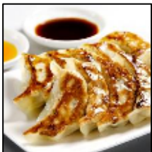
横浜中華街の老舗 【四五六菜館】 「四五六菜館餃子」