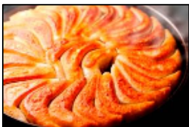
西日本餃子王 鉄なべ荒江本店 「鉄なべ餃子」