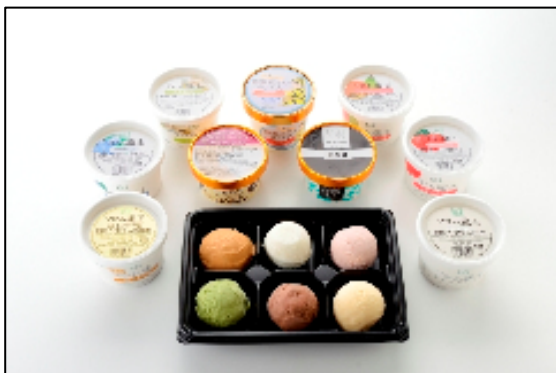
「ご当地アイスパーラー」では ご当地アイスの盛り合わせで食べ比べ