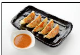
神戸南京町の名店 【皇蘭】 「神戸味噌だれ餃子」