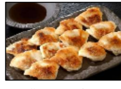
芦屋の一口餃子 【壱心】 「一口餃子 壱心」