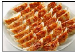
博多一口餃子発祥 【薬院 宝雲亭】 「宝雲亭一口餃子」