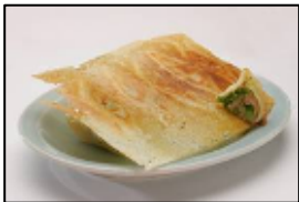
羽根付き餃子発祥【ニイハオ】 「元祖羽根付き餃子」