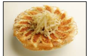
浜松餃子の草分け的存在 【石松】 「石松餃子」