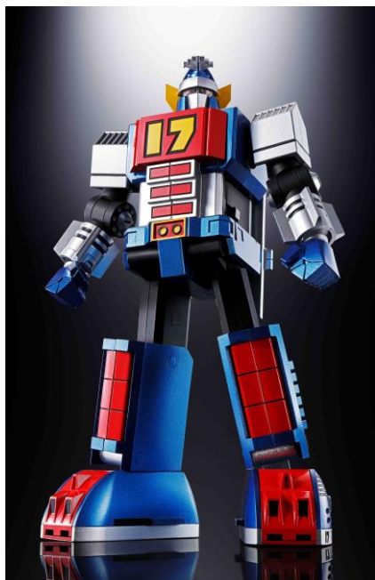
『超合金魂 GX-101 大鉄人17』

なお、大鉄人17の弟ロボットとして、TVシリーズの中盤に登場した「ワンエイト」も、本商品と同スケールにて企画進行中です。