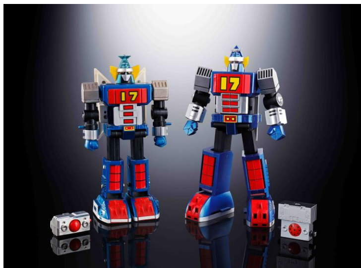
1977年発売「DELUXE 超合金 大鉄人17」（左）との対比