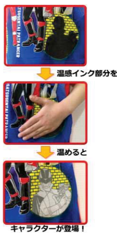
▲温感インク部分イメージ