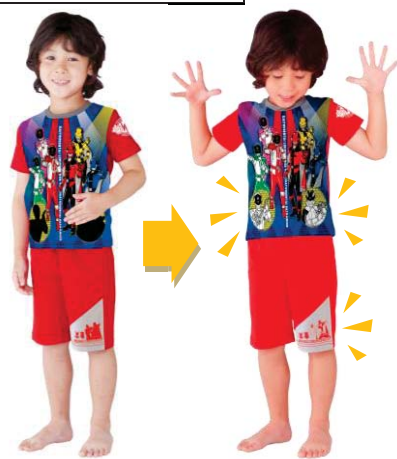
▲着用イメージ 左)温感インク部分を温める前 右)温めた後