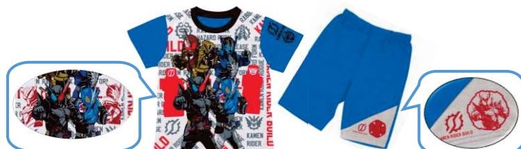
▲『カラチェンパジャマ 仮面ライダービルド』 (2色展開:ブルー・サックス)

(各3,132円・税8%込/各2,900円・税抜、2018年4月19日(木)より順次発売、サイズ:100～130cm)