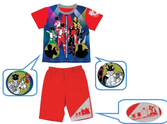
▲商品と温めた後のイメージ(吹出内)

▲『カラチェンパジャマ 快盗戦隊ルパンレンジャーVS警察戦隊パトレンジャー』(2色展開:レッド・全グレー)