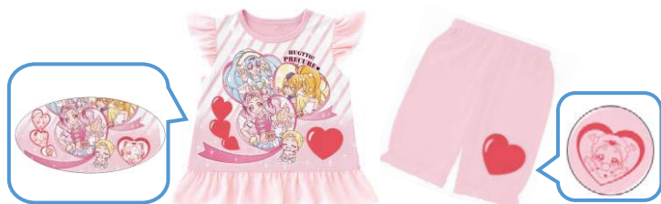
▲『カラチェンパジャマ HUGっと！プリキュア』 (2色展開:ピンク・サックス)

▲『カラチェンパジャマ 快盗戦隊ルパンレンジャーVS警察戦隊パトレンジャー』(2色展開:レッド・全グレー)