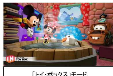
「トイ・ボックス」モード

本作ではゲームの中で手に入れたアイテム(乗り物、建物、キャラクター等)を組み合わせて自分だけの世界を自由に作ることでできる「トイ・ボックス」モードでこれまでに発売された『ディズニーインフィニティ』シリーズの対応フィギュアも、すべてご使用いただけます。