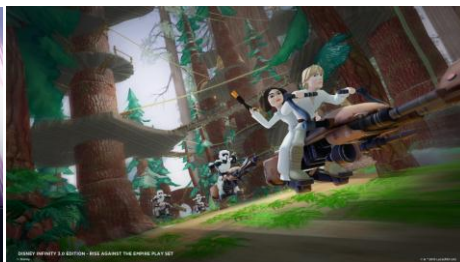
「ディズニーインフィニティ 3.0」ゲーム画面