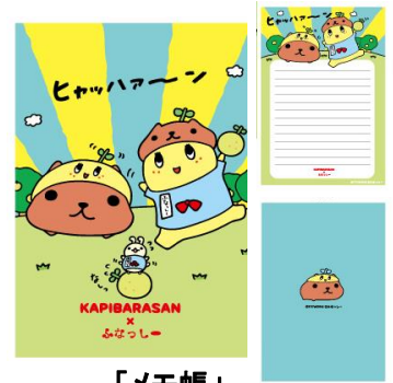
「メモ帳」 486 円(税 8%込)/450 円(税抜)