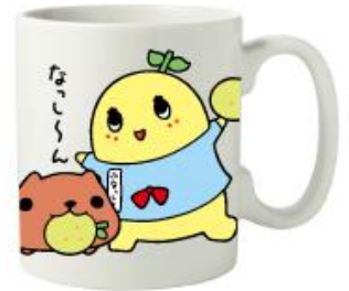
「マグカップ」1,296 円(税 8%込)/1,200 円(税抜)