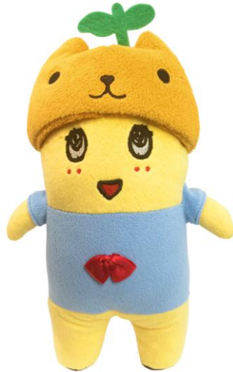
「ぬいぐるみ(ふなっしー)」 1,944 円(税 8%込)/1,800 円(税抜)