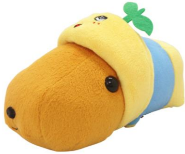
「ぬいぐるみ(カピバラさん)」 2,160 円(税 8%込)/2,000 円(税抜)