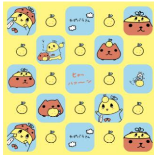
「ハンドタオル」 648 円(税 8%込)/600 円(税抜)