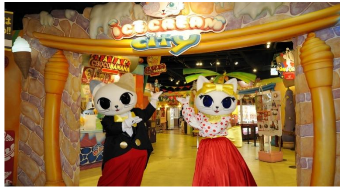
【2003年】“未体験&新感覚”をテーマに、アイスクリーム専門店が広がる「アイスクリームシティ」