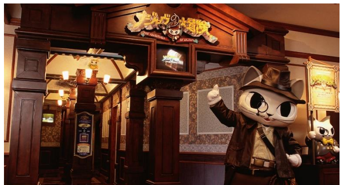
【1999年】園内に隠された“究極の秘宝”を求めて旅する街巡りアトラクション「ナジャヴの大冒険」

※ニュースリリースの情報は発表時現在のものです。発表後予告なしに内容を変更、中止することがあります。※画像はイメージです。