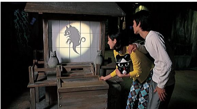
【1997年】お化けや妖怪をテーマにした街区「もののけ番外地」内の街巡りアトラクション「もののけ探険隊」