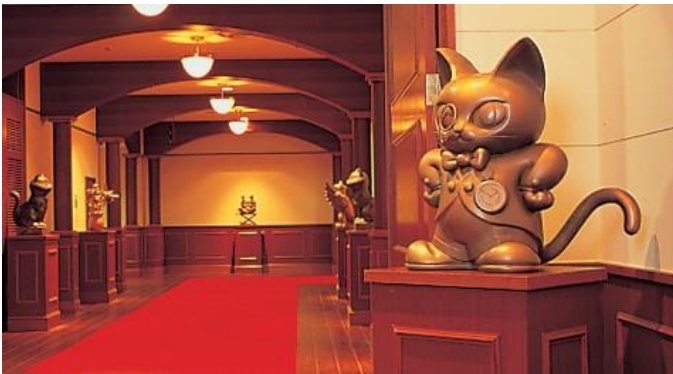
【1996年】園内各エリアのキャラクターの銅像が並ぶナンジャタウンの玄関口「スターロード」