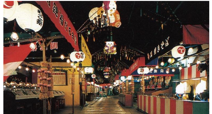
【1996年】焼きそばや金魚すくいなどの縁日屋台風に9つのアトラクション広がる「福袋縁日銀座」