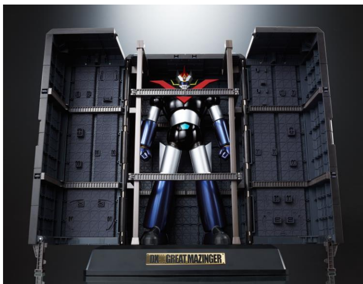
『DX 超合金魂 グレートマジンガー』

53,784 円・税 8%込/49,800 円・税抜、2015 年 12 月 26 日(土)発売