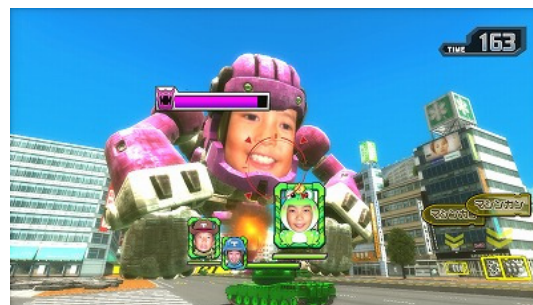
ゲーム画面(「オレコングモード」)

『「基本パック」を無料で遊んでみてパッケージ版を購入する』、『遊びたいモード・ステージだけダウンロードで購入する』など、プレイヤーの遊び方に合わせた購入方法を選択することができます。