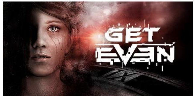
©BANDAI NAMCO Entertainment Europe S.A.S developed by The Farm 51 Group S.A. All rights reserved.

また、第2弾『LITTLE NIGHTMARES-リトルナイトメア-』、さらに第3弾『Impact Winter インパクト・ウインター』のリアル謎解きゲーム展開を予定しています。(詳細は追ってお知らせします。)