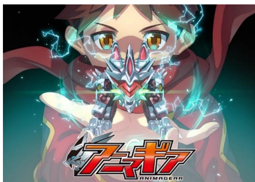
▲新 IP「アニマギア」のキービジュアル

株式会社バンダイ(代表取締役社長:川口勝、本社:東京都台東区)は、動物などの生物をモチーフにした手の平サイズのロボットがバトルを繰り広げる新 IP「アニマギア」の詳細情報を 2019年5月15日(水)に解禁し、そのロボットを組み立てられる食玩の新シリーズ『アニマギア』(第1弾 全5種、各421円・税8%込/各390円・税抜)を全国のスーパー・コンビニエンスストアなどのお菓子売場で 2019年8月より順次発売します。関節を動かすことができる骨格パーツにより、自由自在なポージングが可能のほか、装甲パーツを組み合わせることでカスタマイズを楽しめる点が特長です。