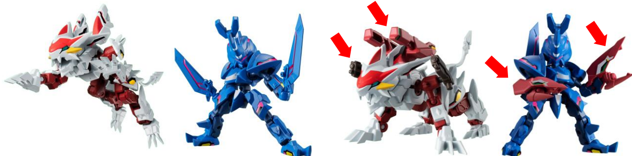
▲骨格パーツにより自由自在なポーシングが可能