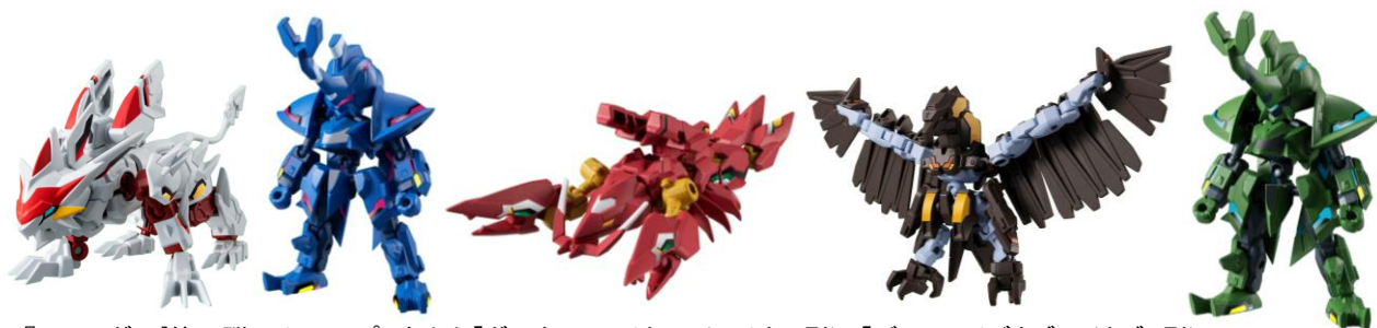
▲『アニマギア』第1弾ラインアップ 左から「ガレオストライカー」(ライオン型)、「デュアライズカブト」(カブト型)「アームズギロテッカー」(ザリガニ型)、「ソニックイーグリット」(ワシ型)、「デュアライズカブト アーミータイプ」(カブト型)