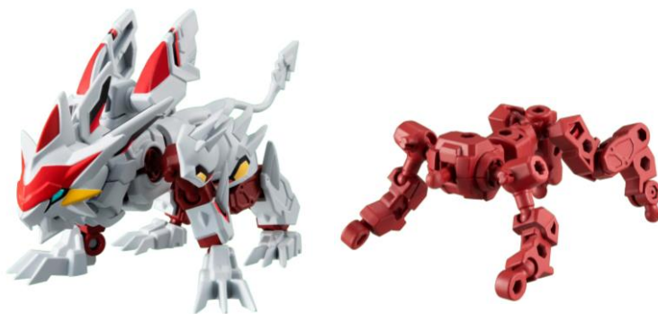
▲(左)『アニマギア』の「ガレオストライカー」 (右)骨格パーツの「ボーンフレーム」(ガレオストライカー)