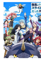
「転生したらスライムだった件」