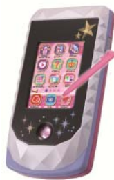
「アイカツフォンルック」