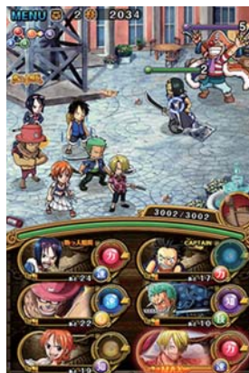
「ONE PIECE トレジャークルーズ」

©尾田栄一郎/集英社・フジテレビ・東映アニメーション ©BANDAI NAMCO Games Inc.