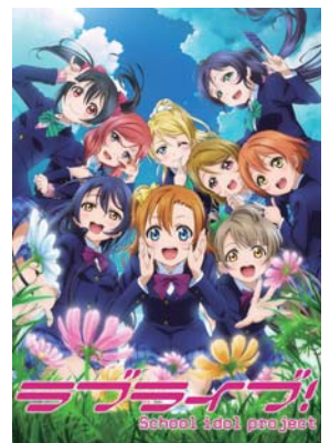
「ラブライブ!」関連商品

©尾田栄一郎/集英社・フジテレビ・東映アニメーション ©BANDAI NAMCO Games Inc.