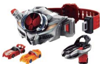
「変身ベルト DXドライブドライバー&シフトブレス」