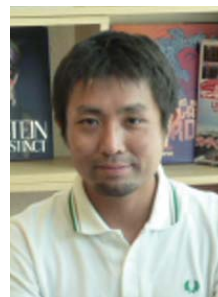
2005年4月入社、2012年より現職

A 2015年に「ランティス祭り」の海外公演を予定しています。計6都市でそれぞれ約3,000人規模の会場で開催を予定しています。海外は国ごとに環境が違いますが、ランティス所属のJAM Projectで海外公演の経験がありますので、そのノウハウを活かし、ぜひ成功させたいと思っています。