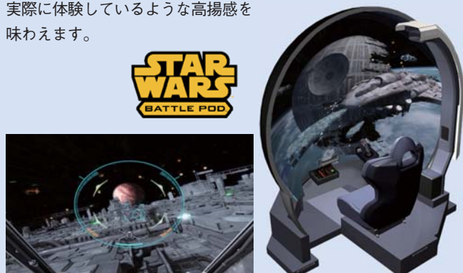
STAR WARS © & ™ 2014 Lucasfilm Ltd. All rights reserved.

ゲームには、『スターウォーズ』ファンなら誰も興奮するエピソード4~6の激戦を再現した5つのステージを収録。爆発や破壊の衝撃を感じる体感ギミックも多数搭載し、映画の名場面を実際に体験しているような高揚感を味わえます。