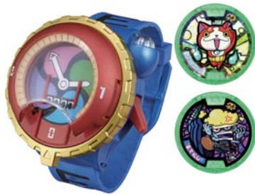
「妖怪ウォッチ」関連商品